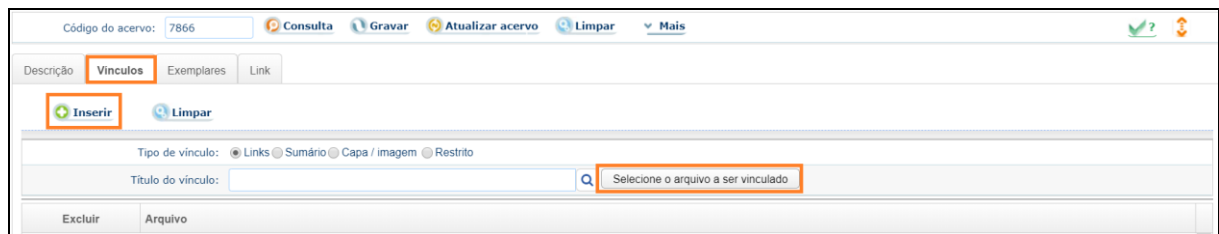
Figura: Catalogação – Vínculos