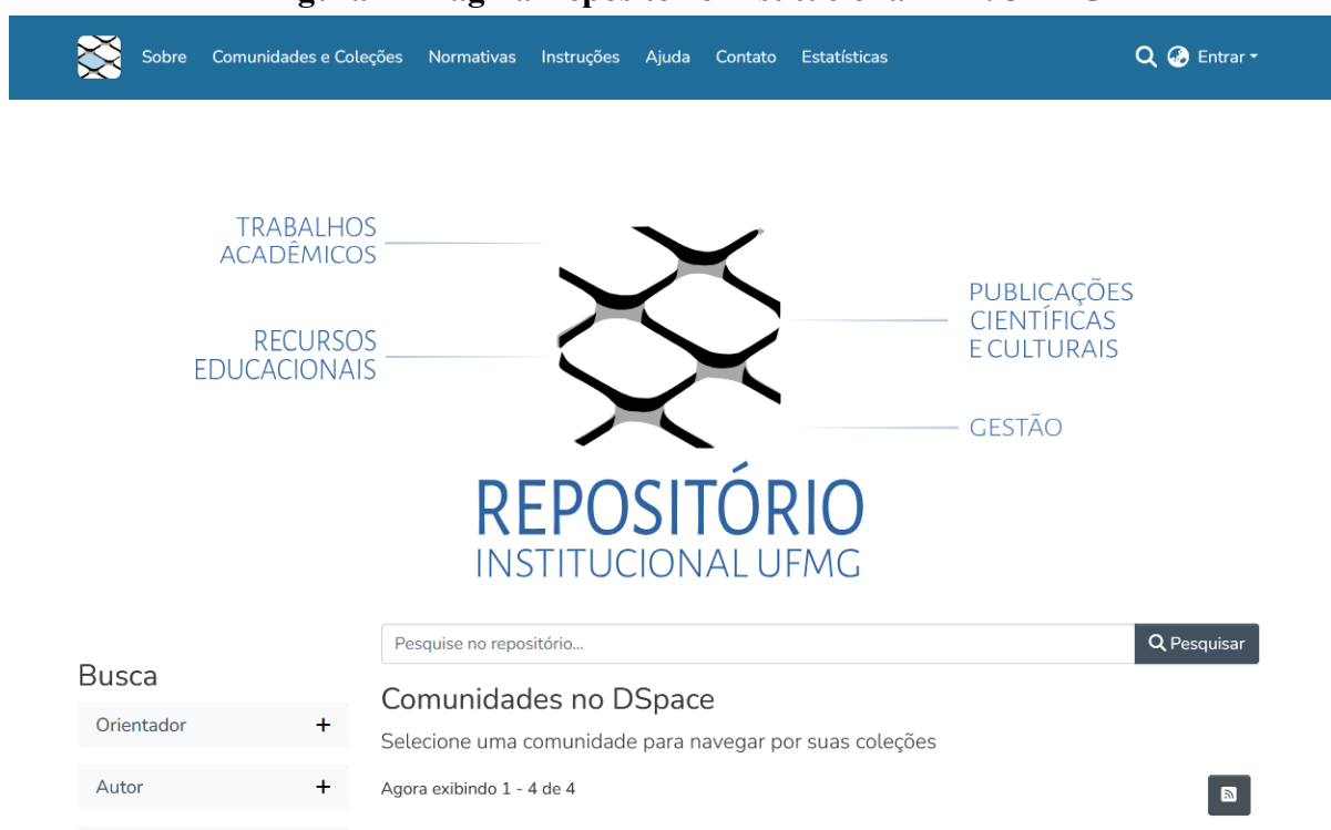
Figura 2 – Página Repositório Institucional – RI/UFGM 4

Com mais de 60 mil itens disponíveis para consulta pública, o Repositório da UFGM abriga teses, dissertações, monografias, artigos, livros, capítulos de livros e recursos educacionais, reafirmando o compromisso da instituição com o avanço do conhecimento científico. Ao garantir o acesso livre e democrático a esse vasto acervo, a UFGM fortalece seu papel na construção de uma sociedade mais justa, equitativa e informada.